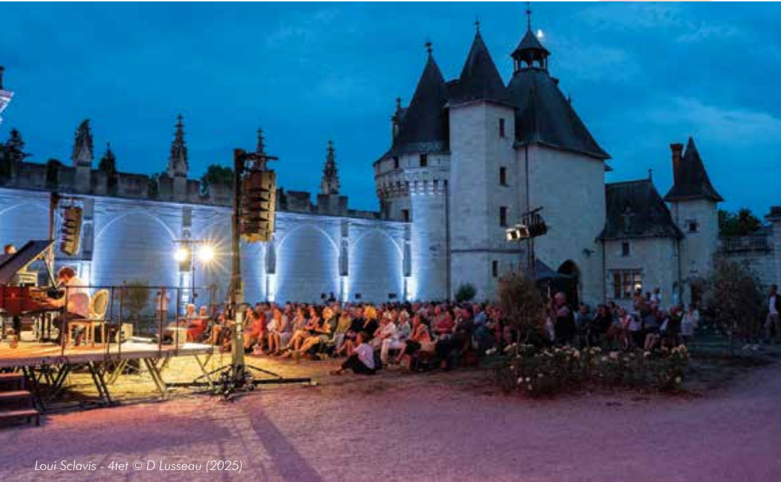
Louï Sclavis - 4tet © D Lusseau (2025)